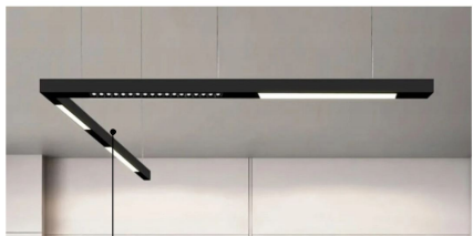
WISZĄCA LAMPA SZYNOWA NAROŻNA LED Z ŁĄCZNIKIEM KĄTOWYM 3000K,

UWAGA: WSZYSTKIE ZDJĘCIA UJĘTE W DOKUMENTACJI SĄ POGLĄDOWE KOLORYSTYKA MEBLI DO USTALENIA Z ZAMAWIAJĄCYM NA ETAPIE REALIZACJI INWESTYCJI!